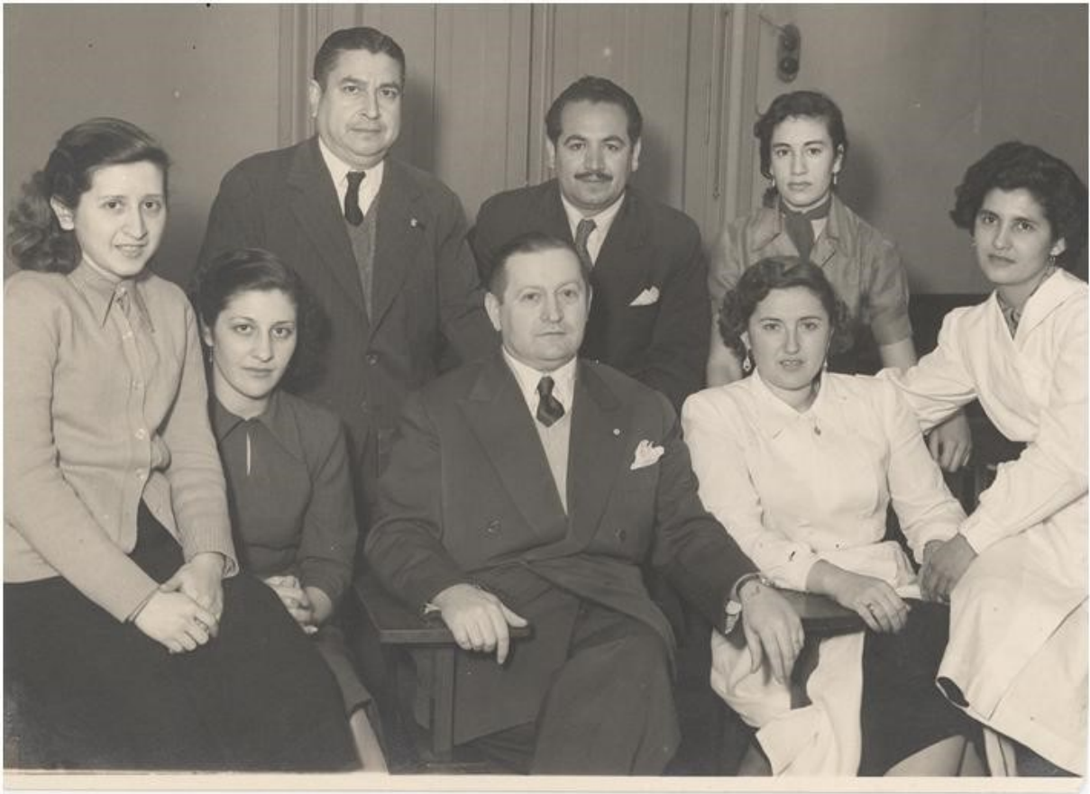
Curso Visitadoras de Higiene, 1952.

La matrícula venía decreciendo por lo que las autoridades decidieron flexibilizar las condiciones para el ingreso y el cursado. Se reemplazó el examen de admisión por una “prueba de carácter vocacional” y se eliminó el pago de la matrícula y los derechos de examen. Esta cuestión finalmente se “resuelve” transitoriamente en 1953 por el efecto del cierre del Liceo Social de Rosario (Britos, 2003) y la afluencia a Santa Fe de las alumnas rosarinas con el objetivo de terminar sus estudios. No obstante, la disminución de estudiantes parecía seguir siendo un problema. Entre otros inconvenientes, las becas eran insuficientes y se asignaban en forma tardía, por lo que muchos estudiantes debían volver a sus hogares. Para solucionar este aspecto del problema, se creó un internado para los estudiantes provenientes del interior provincial. Finalmente, en 1956, por el decreto N° 6985, se restituye la Escuela de Visitadoras de Higiene Social a la Cruz Roja Argentina que había sido su creadora.