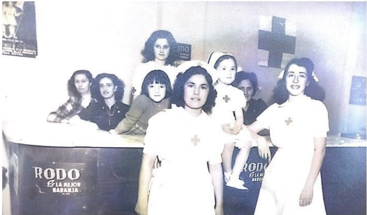
Stand de la Cruz Roja filial Santa Fe en la exposición anual de la Rural atendido por "damas, señoritas y niñas de nuestra sociedad". S/F.