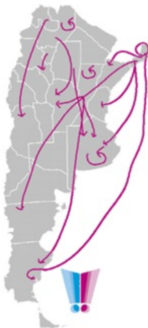
FIGURA 1 Rutas de la trata de personas con fines de explotación sexual

Datos contruidos a partir del relevamiento de causas, UFASE-INECIP (El mapa solamente indica circuitos conocidos, pero no da cuenta de la afluencia de los mismos)