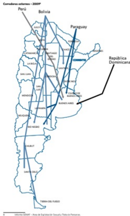
FIGURA 4 Rutas de trata desde el exterior hacia provincias de Argentina