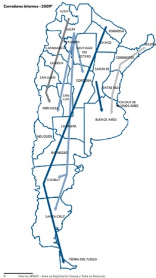
FIGURA 5 Rutas de trata internas de Argentina