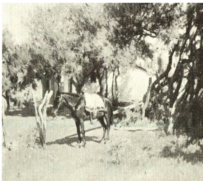
Figura 4. Juan Peláez, La hora de la siesta (1922)