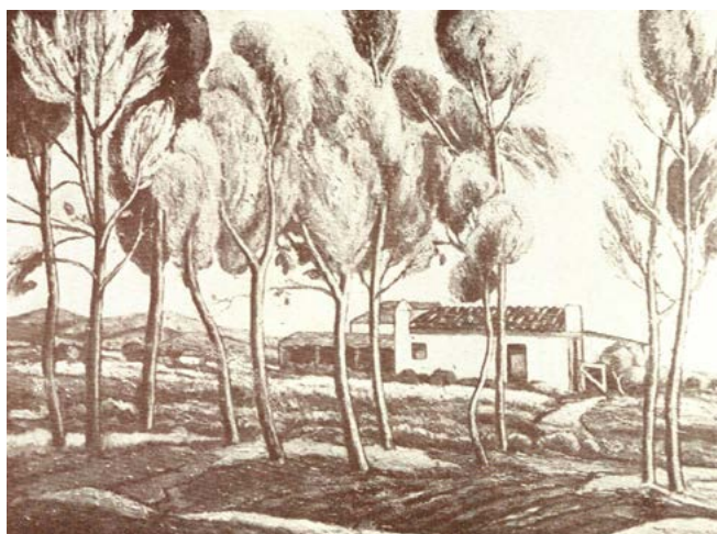
Figura 5. Fernando Pascual Ayllón, Serenidad (1929)