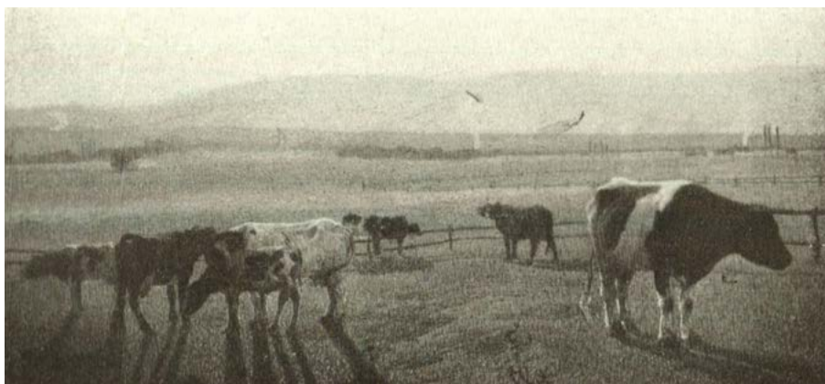
Figura 3. Antonio Pedone, Tarde serena (1920)