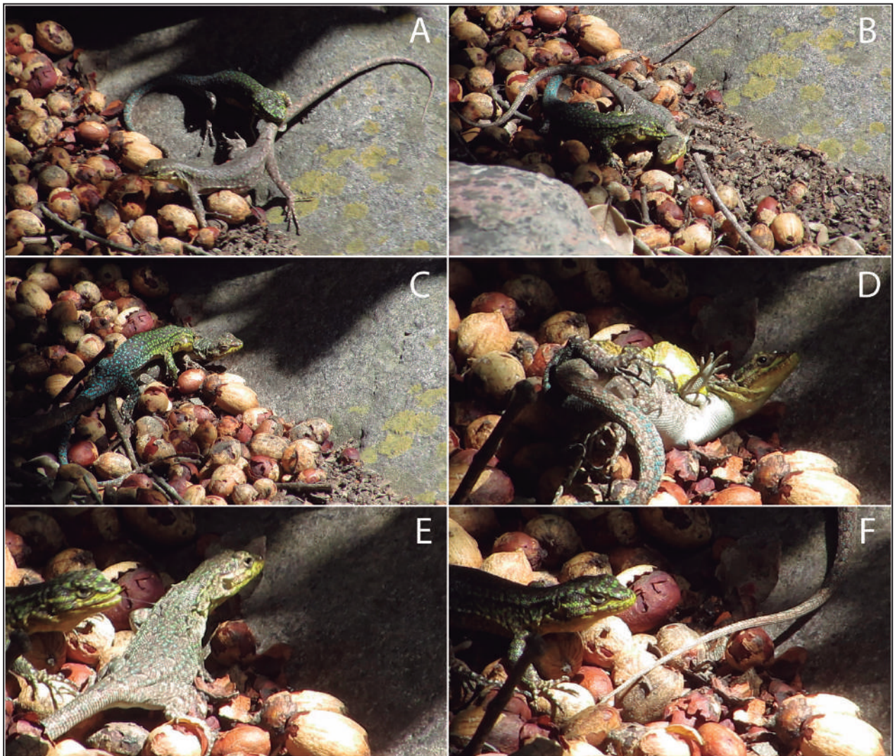
Figura 2. Secuencia de conductas observadas durante la cópula o parada nupcial de Liolaemus tenuis . (A) Envestida, (B) agarre o sujeción, (C) monta, (D) cópula, (E) separación genital y (F) retirada.

machadoi (Rodríguez-Domínguez y Molina-Borja, 1998), no se observaron despliegues de cabeceos o head bobs de la hembra durante la cópula. Lo cual podría indicar la receptividad de la hembra durante el acto. Resulta interesante, que la secuencia de pasos observados es muy similar a las observadas en L. manueli (Valladares y Briones, 2012), una especie alejada filogenéticamente de L. tenuis (Aguilar-Puntriano et al. , 2018). Lo cual sugiere que es una conducta adquirida muy temprano en la radiación de los lagartos Liolaemus .