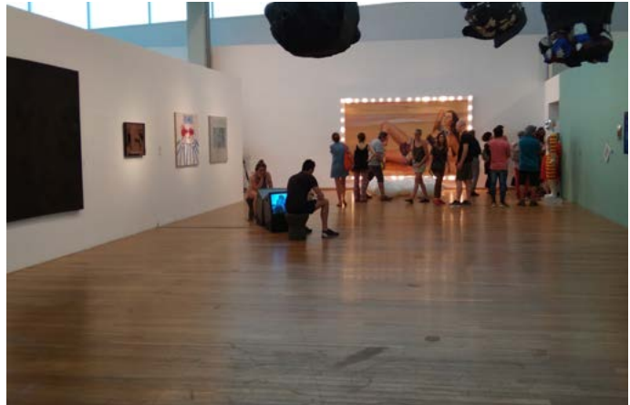
Vista general del espacio central de exhibición

¿Qué tipo de estrategias se vieron implicadas en el espacio expositivo? ¿De qué manera la biografía intelectual de Masotta organizó las secciones de la muestra?