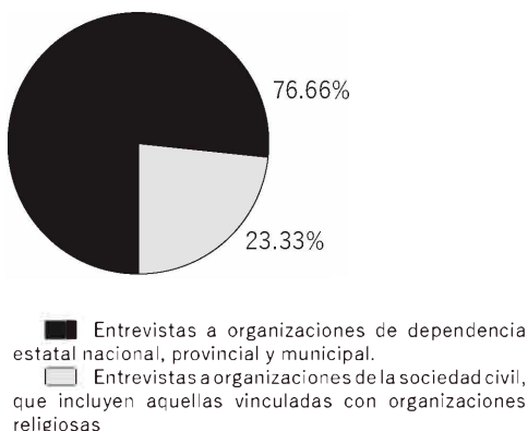
Grafico nº 2